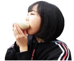
上下ひっくり返すのがあぐり流!

一般的な豚まんは上下そのままに食べても具がこぼれることはないのですが、あぐりの豚まんは具がたっぷり入っています。これをこぼさず食べるには上下をひっくり返してどんぶり状にすることをお勧めします。この食べ方があぐり流!!