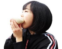
上下ひっくり返すのがあぐり流！

一般的な豚まんは上下そのままに食べても具がこぼれることはありませんが、あぐりの豚まんは具がたっぷり入っています。これをこぼさず食べるには上下をひっくり返してどんぶり状にすることをお薦めします。この食べ方があぐり流！！