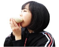
上下ひっくり返すのがあぐり流！

一般的な豚まんは上下そのままに食べても具がこぼれることはありませんが、あぐりの豚まんは具がたっぷり入っています。これをこぼさず食べるには上下をひっくり返してどんぶり状にすることをお勧めします。この食べ方があぐり流！！